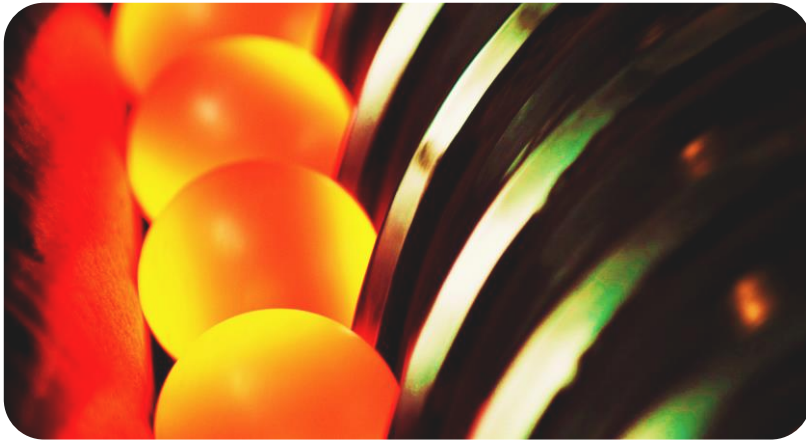
Bola de molienda para minería