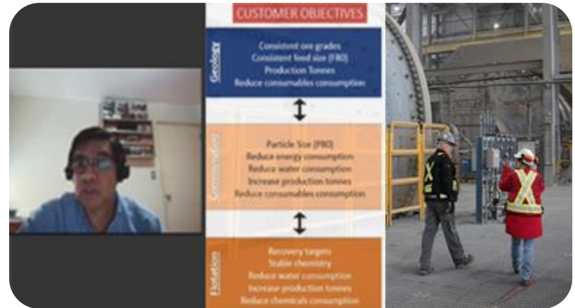
Asesoría/Consultoría a clientes (digital y presencial)