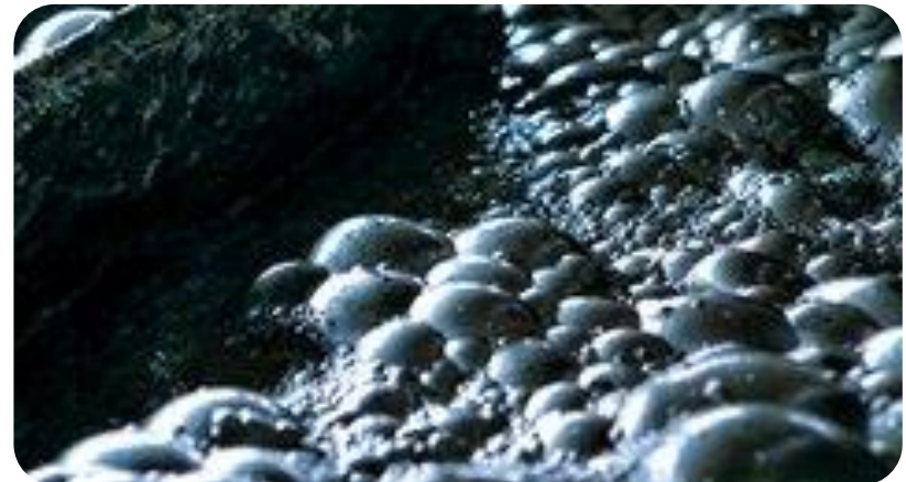
Reactivos de flotación