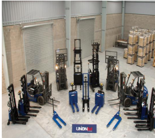
Equipos de manipulación