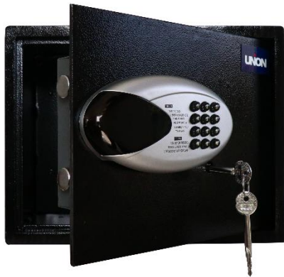
Cajas de seguridad