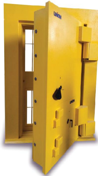
Puertas para bóveda